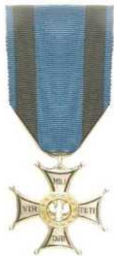
Srebrny Krzyż Virtuti Militari