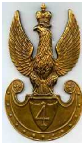
Orzełek 4 ppleg