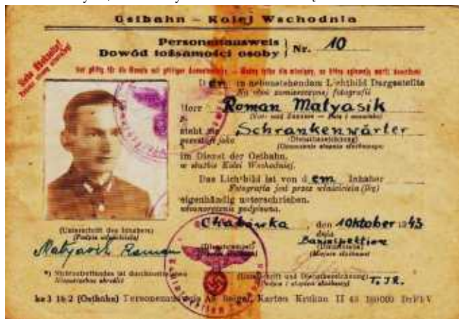
Dowód tożsamości kolejarza