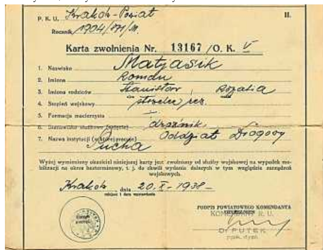
Kolejarze zostali zmobilizowani do służby na kolei