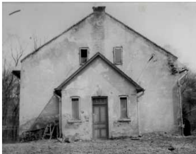
Budynek "sekretarzówki" - stan w chwili przekazania go parafii