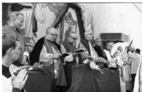
Sidzina 16-06-1966 r.