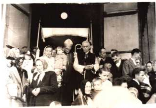
07-05-1962 r. Bystra

„16 VII 1966 - przybył do Sidziny koło Jordanowa na odpust. Odprawił Msz w. i wygłosił kazanie. Serdecznie witany przez górali.