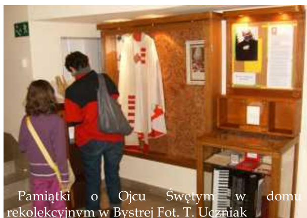
Pamiętki o Ojcu Świętym w domu rekolekcyjnym w Bystrej

11 VIII 1974 godz. 16:00 - Rdzawka, Olszówka, Sidzina Wielka Polana- odwiedziny oaz.