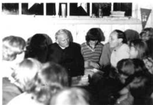
Oaza w Sidzinie.

w tym miejscu jak i pamiątki z tego okresu – fotografie czy wpisy w pamiętniku.